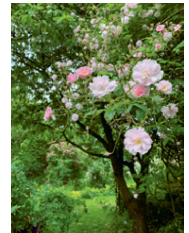
↑ 'Paul's Himalayan Musk' blommar rikt från slutet av juni och en månad framåt.

”Oj, det här hade jag inte väntat mig! Från vägen syns ju ingenting”. När jag hör sådana förvånade utrop från människor som hälsar på i trädgården för första gången blir jag glad. Jag har lyckats överrumpla dem redan i Gröna havet. En trädgård ska överraska och bjuda på hemligheter. Jag minns när hela den nyanlagda trädgården låg som en öppen bok framför ens ögon. Inte ett träd eller buske skymde sikten, utom vid Gamla täppan. Allt var överblickbart, lätt att läsa av och lika spännande som en golfbana. Kan jag skriva nu, snart fyrtio år senare, när jag ser mer objektivt på trädgårdens historia.